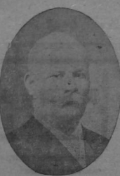
Ex-Presidente don José Santos Zelaya, de quien son las cartas autógrafas que reproducimos.